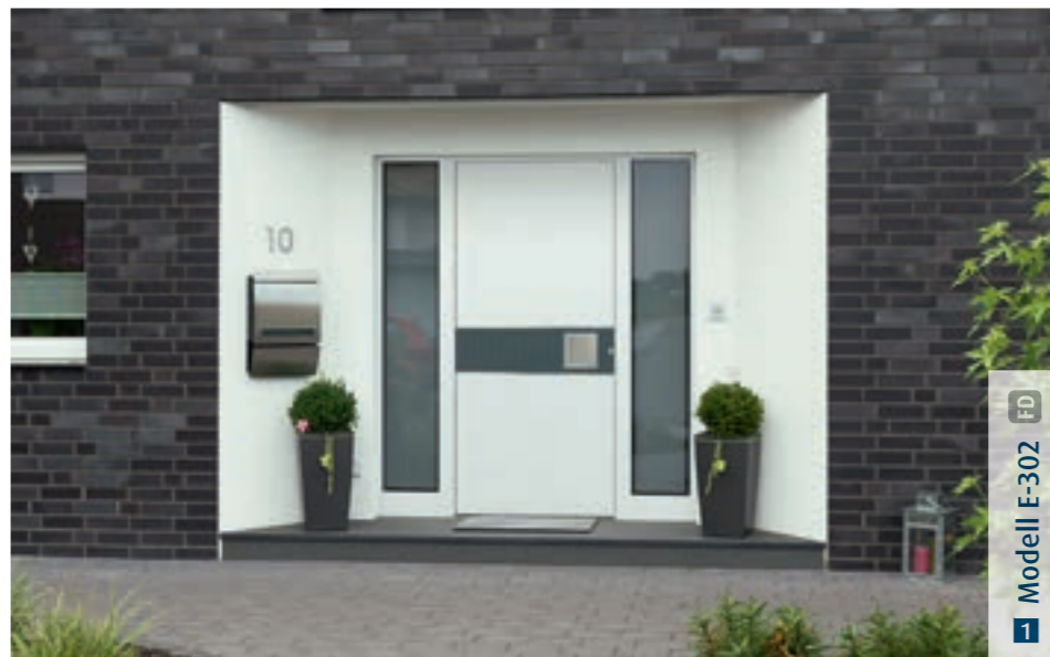
FD Modell E-302