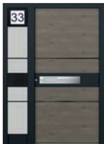
FD Modell E-247 L