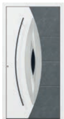
FD Modell E-295 L