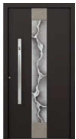
FD Modell E-265 A