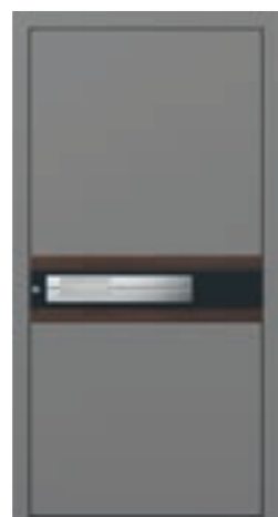
FD Modell E-246