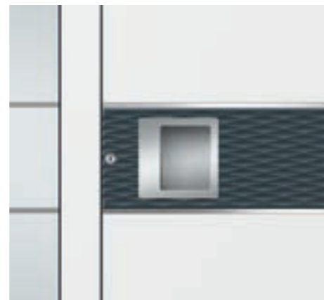
T: KÖtherm 96 mit Seitenteilen, RAL 9016 F: Aufdoppelung mit Wellenkante RAL 7016 nur außen G: 789 Float mattiert mit klarem Rand Z: Handhabe 24476