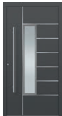
PL FD Modell E-290 L