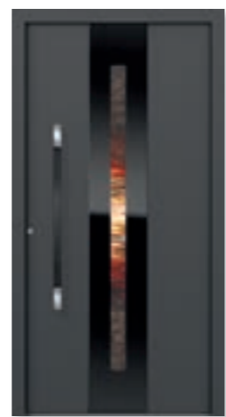
FD Modell E-316