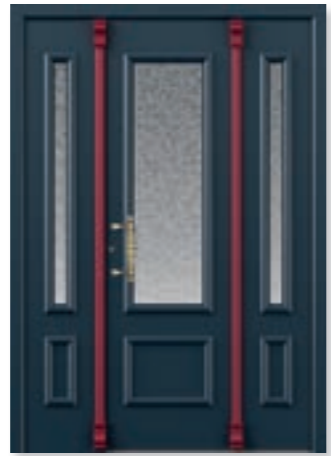
9 Chagall 140 L FD

T: KÖtherm 96 mit Seitenteilen, 0673 Silbergrau Feinstruktur F: 0278 black lizard / 0795 Classic T5 mit Wellenkontur nur außen G: Motivverglasung 1501 auf Screen Z: Handhabe 24150